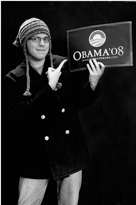
Interview ohne Worte: Das Projekt „rethink 08“ bat US-Studenten, ihre Gefühle zum Zeitpunkt der Obama-Wahl ...