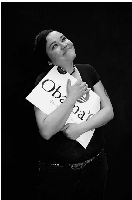
Bei vielen anderen jungen Wählerinnen und Wählern sieht man einen Stimmungsumschwung von Entzücken ...

BILANZ Ein Jahr Barack Obama. Gesundheitsreform, Guantánamo, Afghanistan – ist der „change“ jetzt da oder nicht? Ein inneres Zwiegespräch