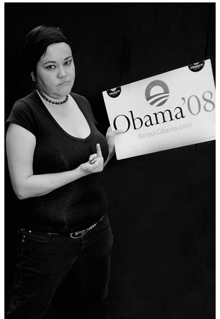
... bis hin zu Wut und Enttäuschung. Alle Fotos der Reihe sind bei rethink08.wordpress.com zu sehen

A n der entscheidenden Stelle wäre ich beinahe eingeknickt. Wieder einmal fragte ein arabischer Kollege nach der deutschen Haltung zum Nahostkonflikt, ein Ritual, das sich in der Berliner Bundespressekonferenz regelmäßig wiederholt. Diesmal schlief ich sogar mit gutem Gewissen, denn bevor ich in den Pressesaal ging, hatte mich ein israelischer Historiker im Morgenradio mit einem wunderbaren Satz beglückt: „Jerusalem ist ein ungelöstes Problem schon 3.000 Jahre lang, und vielleicht bleibt es auch ein ungelöstes Problem für die nächsten 3.000 Jahre.“