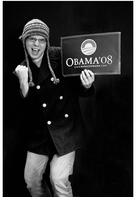
... und wenige Monate später zum Ausdruck zu bringen. Manche von ihnen blieben bei ihrer deutlichen Unterstützung

Aber seine Gegner im eigenen Land lachen sich tot darüber, und tolle neue Allianzen hat Obama international auch nicht schmieden können. Intellektuelle Eloquenz, das merkt er wohl auch selbst, ist für den Präsidenten der USA nicht mal eine notwendige Bedingung – eine hinreichende in keinem Fall. Menno!!!!